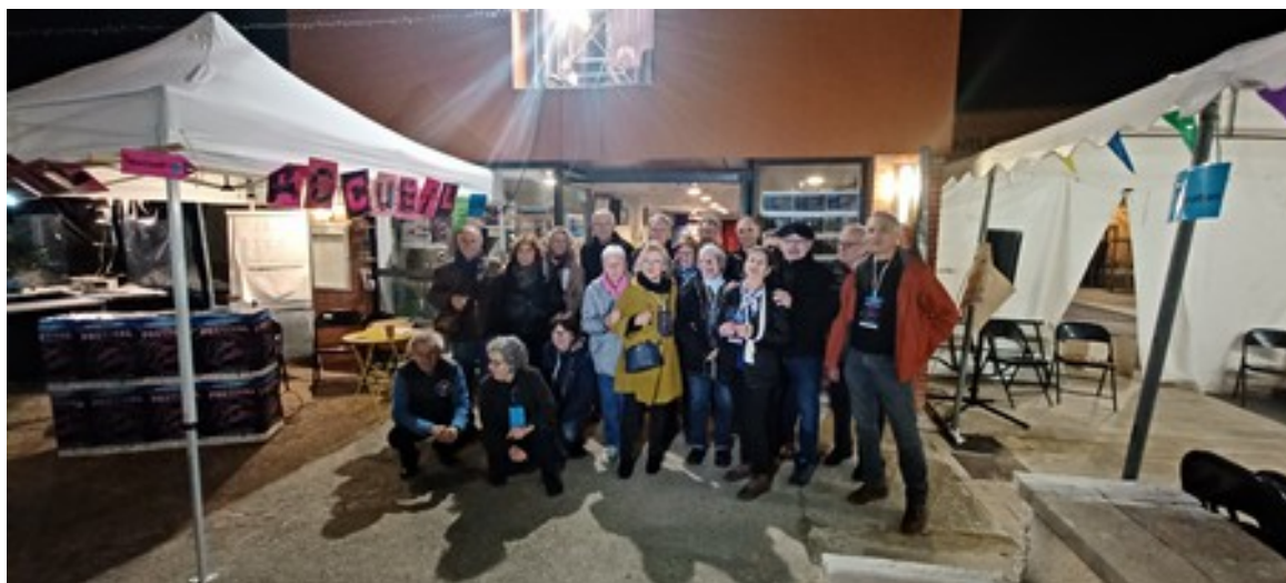
L'équipe du cinéma Liberty

« Depuis plus de 20 ans, le Liberty s'associe régulièrement à des manifestations d'envergure nationale, régionale, départementale mais jusqu'alors n'avait jamais imaginé organiser une manifestation comme un festival. Et puis, cette idée est apparue comme une évidence pour nous car elle représente ce pour quoi nous œuvrons au quotidien : transmettre notre passion du cinéma et la partager avec le plus grand nombre, le public familial comme les cinéphiles. Une transmission et un partage corrélés à un esprit de convivialité permanent qui nous définit en tant que cinéma de proximité.