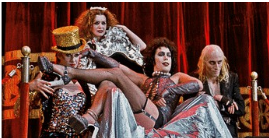
THE ROCKY HORROR PICTURE SHOW