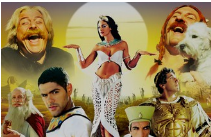
ASTERIX MISSION CLEOPATRE