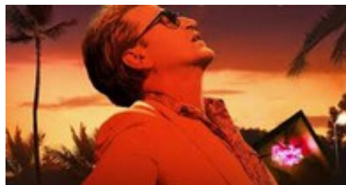
PACIFICTION, TOURMENTS SUR LES ILES