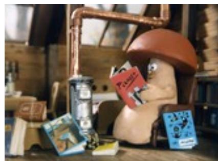
CAPELITO FAIT SON CINEMA