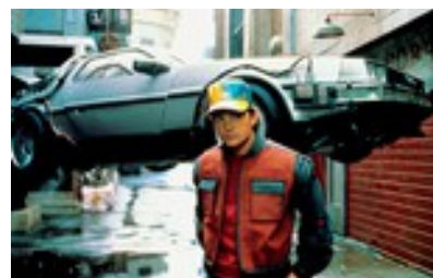
RETOUR VERS LE FUTUR 2