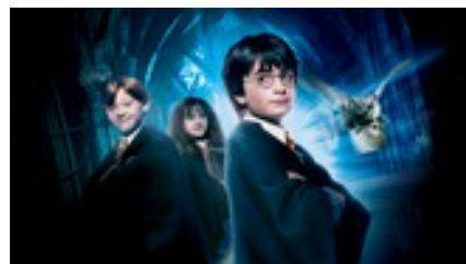
HARRY POTTER A L'ECOLE DES SORCIERS