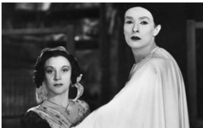
LES ENFANTS DU PARADIS