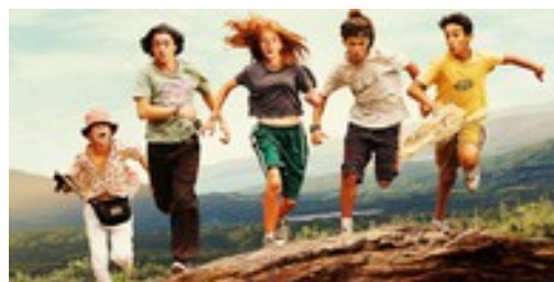
LA PETITE BANDE